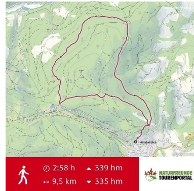
Route, Schwierigkeitsgrad mittel

Wir freuen uns schon auf Eure/Ihre Teilnahme